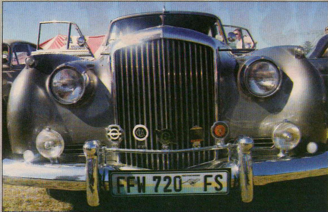
BLINK, silwer, sjiek, antiek – Rolls Royce.